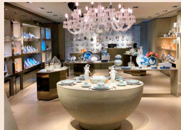
Por M. A. Vista Alegre abrirá el miércoles en el número 467 de la Diagonal.

Vista Alegre se remonta a 1824, cuando abrió la primera fábrica de porcelana de la marca en Aveiro (Portugal). En 2001, Vista Alegre, dedicada hasta entonces a la porcelana, la loza y el gres, se fusionó con el grupo Atlantis, especializado en cristal y vidrio. En 2009, el grupo se integró a Visabeira. La nueva tienda alternará las colecciones clásicas con las más contemporáneas, fruto de colaboraciones con distintos diseñadores.